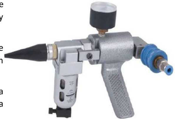
1/4" O.D. to 3" O.D.

Si la lectura en el medidor cae indica un tubo con una fuga.